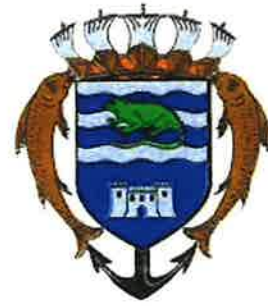
Commune de Terre-de-Haut (Les Saintes)