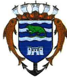
Commune de Terre-de-Haut (Les Saintes)